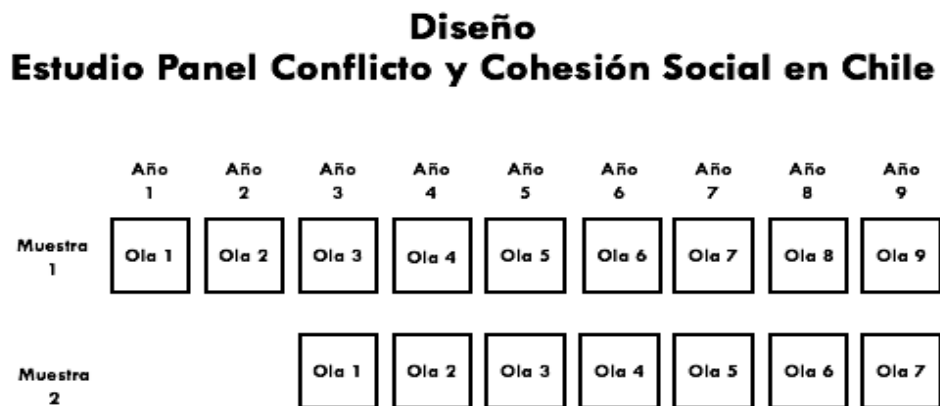
Figura 2: Diseño Muestral de ELSOC según Ola

Según el plan de trabajo contemplado por COES, durante el 2018 se levantará la tercera ola de ELSOC. En esta tercera ola se volverá a entrevistar a las personas encuestadas en la primera ola (2016), donde además se integrará una muestra de refresco de 1400 casos. El objetivo de la muestra de refresco es corregir la subcobertura de ciertos grupos poblacionales y ajustar por la pérdida de casos dado la atrición. Los resultados de la tercera ola estarán disponibles durante el primer semestre del 2019.